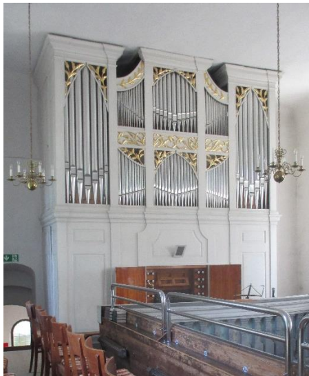
Steinmüller-Orgel Thierfeld, erbaut 1841