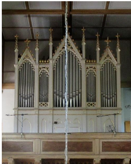
Geißler-Orgel Hartenstein, erbaut 1869/70